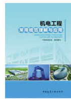
图3《机电工程常用规范理解与应用》

为加深对规范、强制性条文、工程建设标准体系的了解，提高安装技术人员对常用规范的理解和应用水平，中国安装协会组织编写了《机电工程常用规范理解与应用》。本书从机电工程相关法律、法规、规范体系、施工标准出发，以分部（专业）的验收规范为主线，综合相关规范的要求，对强制性条文（本书中以黑体字出现）、容易混淆的条文、质量通病进行重点描述，结合工程实例照片，介绍规范的实际应用效果。本书图文并茂，文字说明言简意赅，简单明了，便于施工技术人员对规范体系的理解和应用。