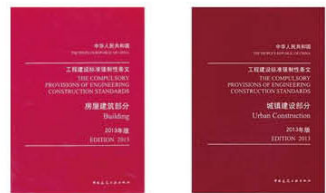
图1《工程建设标准强制性条文》部分最新版本

4、住房城乡建设部关于发布2013年版《工程建设标准强制性条文（铁道工程部分）》的通知 建标[2013]34号