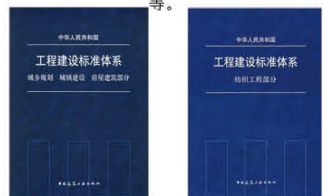
图2《工程建设标准体系》部分最新版本